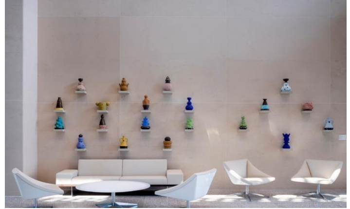
Umetnička instalacija Virgina Scotchie, Serija stvaralac predmeta , 2018.